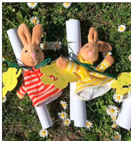
Die Kinder des Kindergartens „Fürstenfeld“ wurden mit einer Osterhasen-Fingerpuppe und einem Ausmalbild von ihren Erzieherinnen überrascht.

Und damit es im „Kindergarten-Homeoffice“ nicht langweilig wird, versenden die Erzieherinnen einmal wöchentlich an die Eltern Mail-Briefe, die Beschäftigungsideen enthalten, zum Beispiel Experimente, Fingerspiele oder Rätsel, Rezepte, Lesetipps für die Eltern, Kurzgeschichten und Märchen, Spiel- und Bewegungsanregungen, kleine Yogaeinheiten, Bastelangebote, etwas im Bereich Zahlen für die Schulfänger, Naturerlebnisse Zuhause (beispielsweise „Tier des Jahres“) oder Dinge, die man auf einem Spaziergang erleben kann.