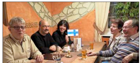
Auch der regelmäßig stattfindende Sprachenstammtisch Café Polyglott ist im Rahmen des bürgerschaftlichen Engagements beim letzten Beteiligungsprozess entstanden.

250 Bürger haben dieser Tage eine persönliche Einladung erhalten. Nach dem Zufallsprinzip wurden sie über das Melderegister ausgewählt. Einige Bürger haben sich schon angemeldet. Da die Festhalle in Wallburg aber jede Menge Platz bietet, würde sich die Stadt über weitere Anmeldungen freuen. Die Bürgerwerkstatt wird vom Ministerium für Arbeit und Sozialordnung, Familien und Senioren, Baden-Württemberg und der Landesanstalt für Umweltschutz, Messungen und Naturschutz Baden-Württemberg gefördert und unterstützt. Weitere Infos und Anmeldung zur Bürgerwerkstatt bei Heike Schillinger, Telefon 07822 / 432102, E-Mail: heike.schillinger@ettenheim.de.