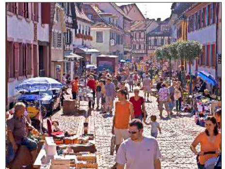
Am 19. August ist wieder Flohmarkt und damit Gelegenheit zum Bummeln, Kaufen und Verkaufen.

Senioren Ettenheimmünster Am Mittwoch, 16. August, findet der nächste Seniorennachmittag im Pfarrheim statt. Es gibt Bier, Brezeln und flotte Musik. Beginn ist um 14.30 Uhr.