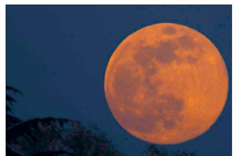
Der Vollmond zeigte sich zu Beginn im Osten in der Nähe des Krankenhauses.