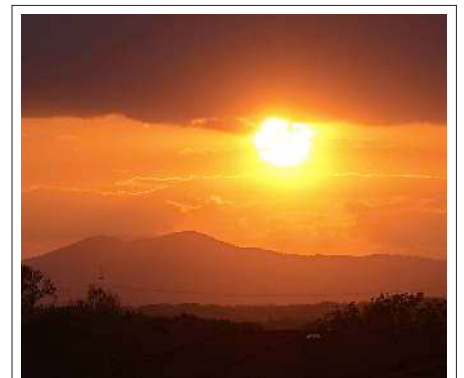
Sonnenuntergang mit Blick auf die Vogesen