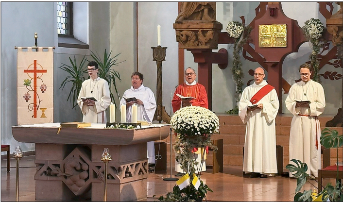
Mit einem Festgottesdienst wurde das Patrozinium in der Kirche St. Cyprian und Justina gefeiert.