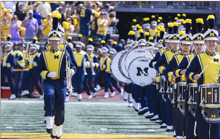
Michigan Marching Band.