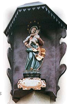
Immakulata am alten Kaplaneihaus