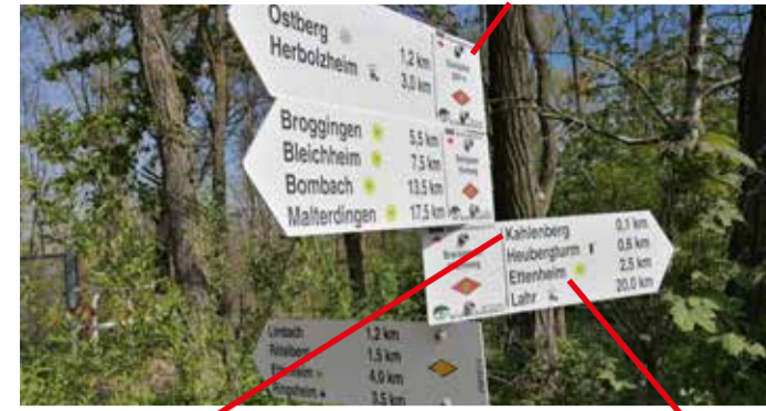
Nächster Wegweiser in dieser Richtung: Kahlenberg 0,1 km Markierung gelbe Raute

Standortfeld mit Angaben zu: Standortname Höhe Art der Markierung